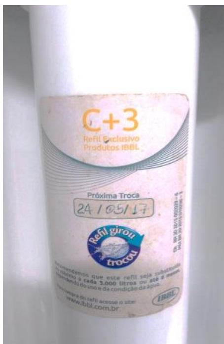
Foto Demonstrativa do Refil do Filtro Utilizada no Pronto Socorro.